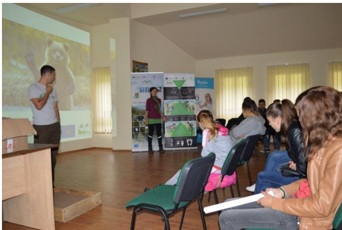
Figura 1. Ziua Parcului Natural Apuseni și PadișFest – Proiectul LIFE Connect Carpathians

că o bună înțelegere de către comunitățile locale a obiectivelor unui proiect în cadrul Programului LIFE a condus la o bună rată de succes și la continuarea în consecință a activităților proiectului.