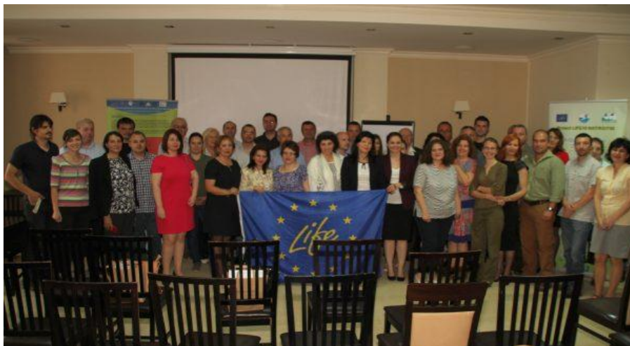
Figura 6. Conferința de închidere a proiectului LIFE – Îmbunătățirea statutului de conservare al speciilor și habitatelor prioritare din zona umedă Porțile de Fier

Au fost realizate și două sesiuni demonstrative de reducere a cantității de biomasă de-a lungul Dunării, împreună cu alți administratori de SPA-uri din cadrul rețelei Natura 2000, recoltarea plantelor acvatică în exces fiind singura metodă certificată care asigură o reducere a efectivului speciilor care concurează cu speciile protejate, fără a introduce în mediu compuși chimici (ierbicide), a draga sau a drena zonele umede. Rezultatul acestei acțiuni a asigurat habitate favorabile pentru iernare și hrănire pentru mai mult de 500 de cormorani mici și habitate pentru alte 12 specii protejate (de ex. Aythya nyroca ).