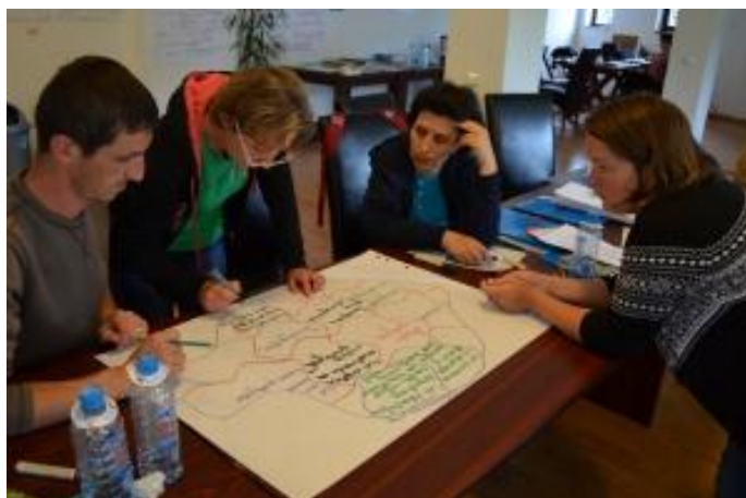
Figura 2. Grup de lucru în cadrul Proiectului LIFE EME Natura 2000