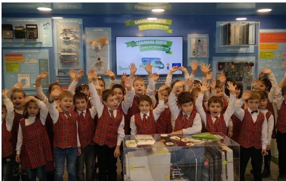
Figura 4. Caravana ECOTIC – Proiect ECOTIC LIFE+ Caravan

Exemplu proiect de succes: Promovarea produselor ecologice (GREEN-PRO) LIFE08 INF/RO/000507 ; Efficient Managers for Efficient Natura 2000 Network LIFE11/INF/RO/00819 ; Raising awareness of the importance of environmentally sound management of WEEE among identified target groups – Romania ECOTIC LIFE+ Caravan .