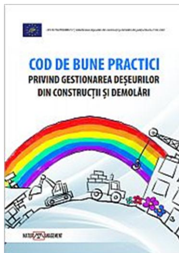
Figura 3. Material realizat în cadrul proiectului LIFE 10 ENV/RO/000727

http://ec.europa.eu/environment/life/project/Projects/index.cfm?fuseaction=search.dspPage&n_proj_id=3253