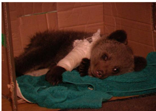
Figura 5. Exemplar de urs brun la centrul de reabilitare